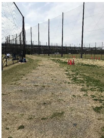
〈競技場外芝生スペース〉