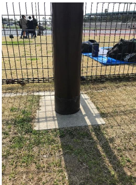
〈競技場外芝生エリアの支柱〉